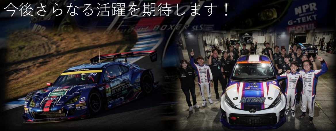
SUBARU BRZ R&D SPORT