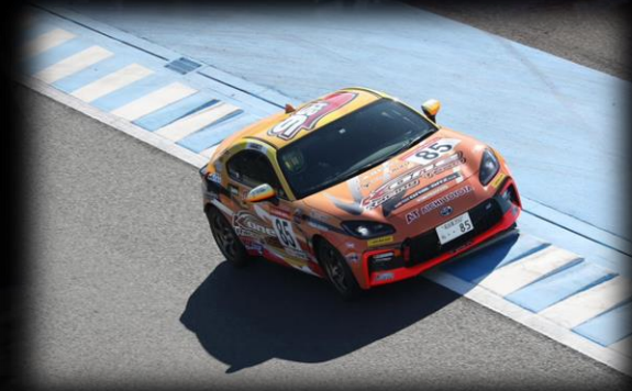
GR86/BRZ Cup PRO 85号車